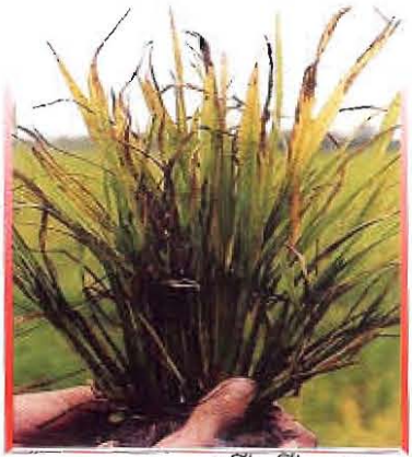
រោគសញ្ញាជំងឺគៀស្មៅ

ជំងឺនេះ បង្កឡើងដោយពពួកវីរុស។ ដើមដែលកើតជំងឺមានលក្ខណៈក្រិនខ្លាំង បែកគុម្ពច្រើនហួសប្រមាណ មើលទៅដូចគុម្ពស្មៅ។ ស្លឹកស្រូវមានរាងរៀវតូចខ្លីៗឡើងវិញ មានពណ៌បៃតងស្លេក និងជូនកាលមានស្នាមអុចពណ៌ច្រេះ។ ស្រូវកើតជំងឺនេះ នៅរស់ធម្មតារហូតដល់ទុំ ប៉ុន្តែបង្កើតកូរតិចតួចណាស់។ កូរដែលចេញមកមានទំហំតូចពណ៌ត្នោត និងមិនដាក់គ្រាប់ (ស្តុក)។ នៅពេលជំងឺកើតមាននៅចុងវគ្គលូតលាស់ រោគសញ្ញានៃជំងឺនេះអាចមិនលេចឡើងនៅមុនពេលប្រមូលផលទេ ប៉ុន្តែអាចនឹងលេចចេញនៅលើខ្លែងដែលដុះលូតលាស់ថ្មី។ ភ្នាក់ងារចម្លងជំងឺគៀស្មៅ គឺសត្វមមាចត្នោត។