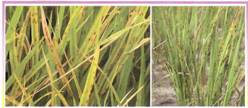
រោគសញ្ញាជំងឺអុចភ្លោតលើដំណាំស្រូវ