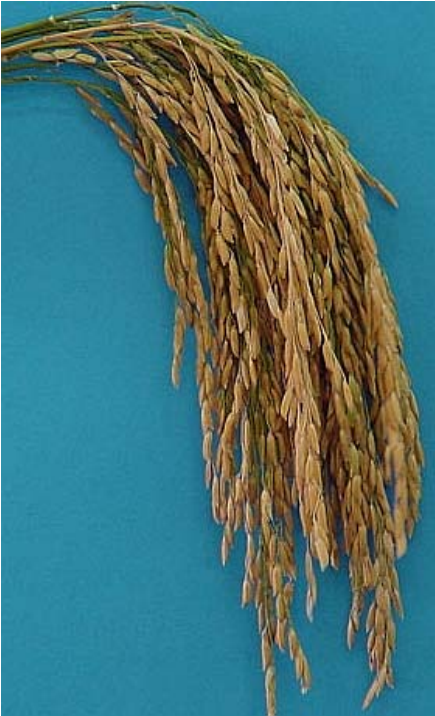
តារាងទី ២