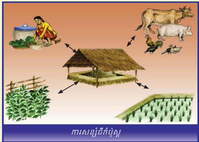
ការសន្សំដីកំប៉ុស្ត