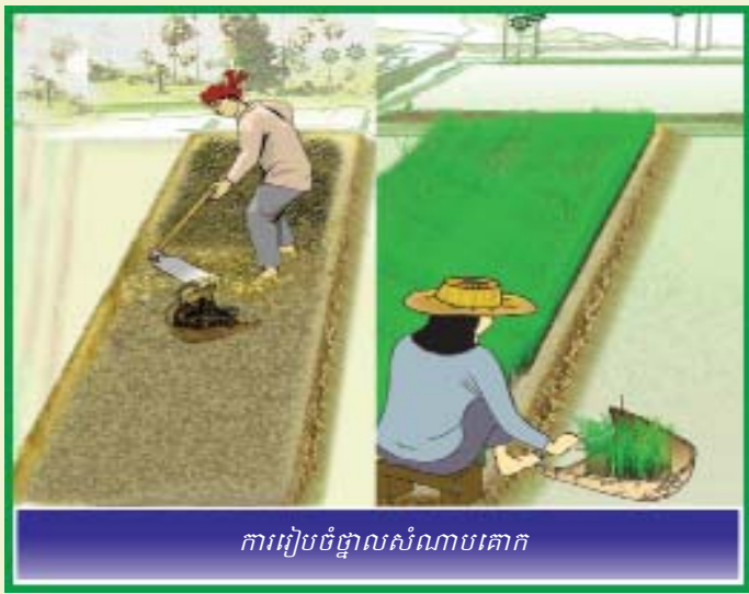
ការរៀបចំថ្នាលសំណាបគោក