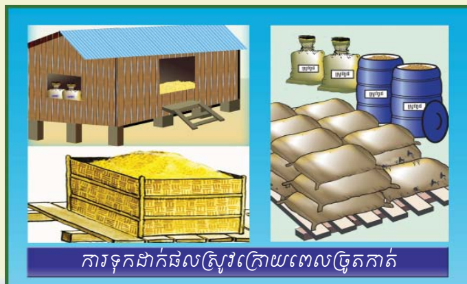
ការទុកដាក់ផលស្រូវក្រោយពេលច្រូតកាត់