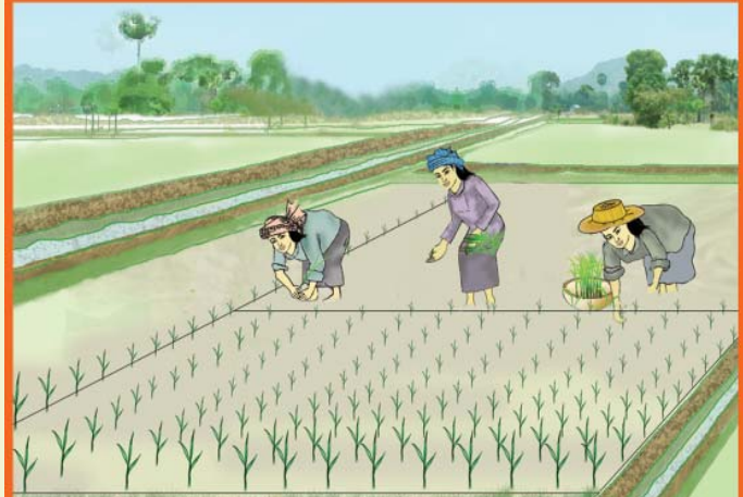
ការស្វែងជាជួរ