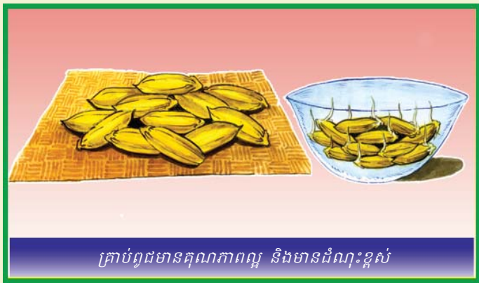
គ្រាប់ពូជមានគុណភាពល្អ និងមានដំណុះខ្ពស់