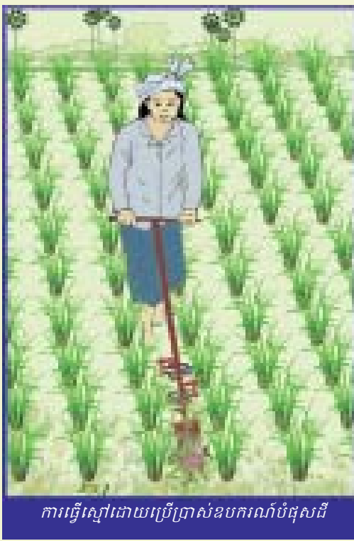
ការធ្វើស្មៅដោយប្រើប្រាស់ឧបករណ៍បំផុសដី

(វិធានចម្រុះ អនុវត្តតទៅ៖ ការពារដំណាំ) ការគ្រប់គ្រងស្មៅចង្រៃ