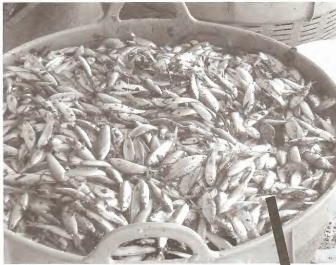
កន្ទក់លាយជាមួយអំបិល កំរាស់ ១ តឹក

ស្អុយ ។ យើងអាចដាក់អំបិល ឬស្ករត្នោត១០-១៥ភាគរយ លាយ ជាមួយកន្ទក់ដើម្បីរក្សាចំណីផ្កាប់នេះបានយូរ ។