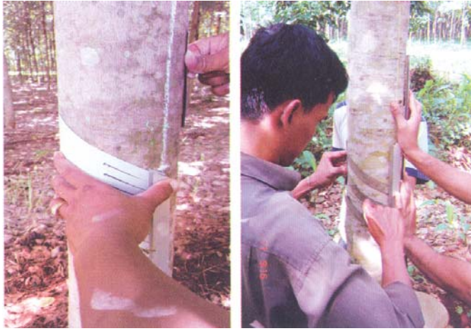
ឧបករណ៍គំរូក្រិតមុខចៀរ ការក្រិតសំបកសម្រាប់ចៀរ