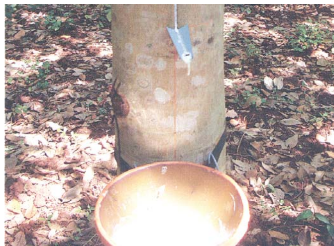
ការបំពាក់ស្លាបព្រា លូសចង់បាន និងបានគ្គង់ជ័រ