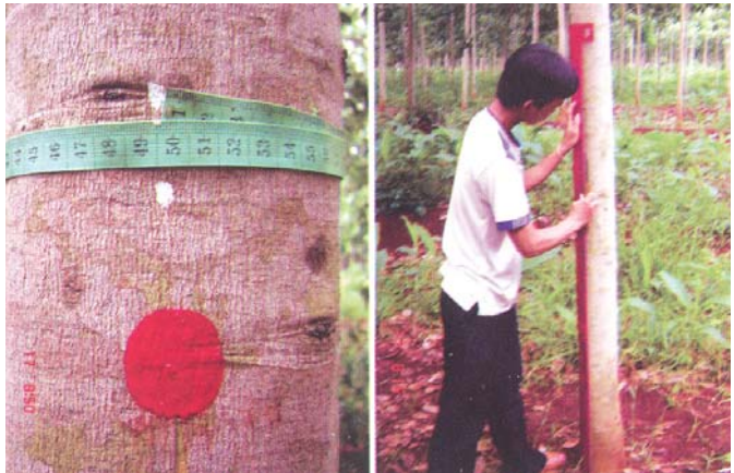
ការដៅចំណុចសម្គាល់ដើមសម្រាប់បើកមុខចៀរ ការចែកផ្ទាំងសំបកជាពីរផ្នែកស្មើគ្នា

ដំបូងត្រូវជ្រើសរើសដើមកៅស៊ូ ដែលមានរង្វង់ ៥០ ស.ម នៅកម្ពស់ ១០០ ស.ម ពីដី បន្ទាប់មកគេដៅនៅកម្ពស់ ១៧០ ស.ម ពីដីនូវសញ្ញា ឬចំណុចសម្គាល់ព័ណ្ណក្រហមលើដើមដែលមានទំហំត្រូវខ្នាត រួចគូសបន្ទាត់ឈរពីឈមគ្នាតាមបណ្តោយដើម ដែលមានចំណុចក្រហមសម្គាល់នោះដើម្បី