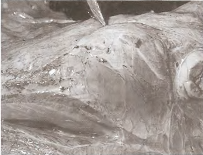
ស្នាមជាំឈាមស្រទាប់ភ្នាសសាច់ខាងក្នុងមាត់