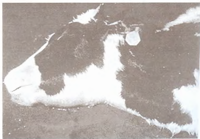
ការហើមមុខ ក្បាល និង ក ដោយសារការរលាកស្រទាប់ភ្នាស សរីរាង្គខាងក្នុង