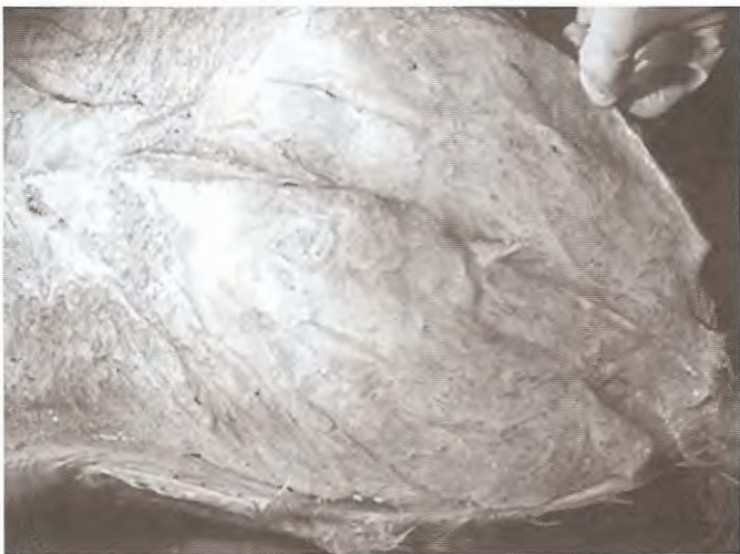
ស្នាមជាំឈាមស្រទាប់ភ្នាសសាច់ខាងក្នុងនៃ ក

- ស្នាមជាំឈាមស្រទាប់ភ្នាសសាច់ខាងក្នុងនៃ ក