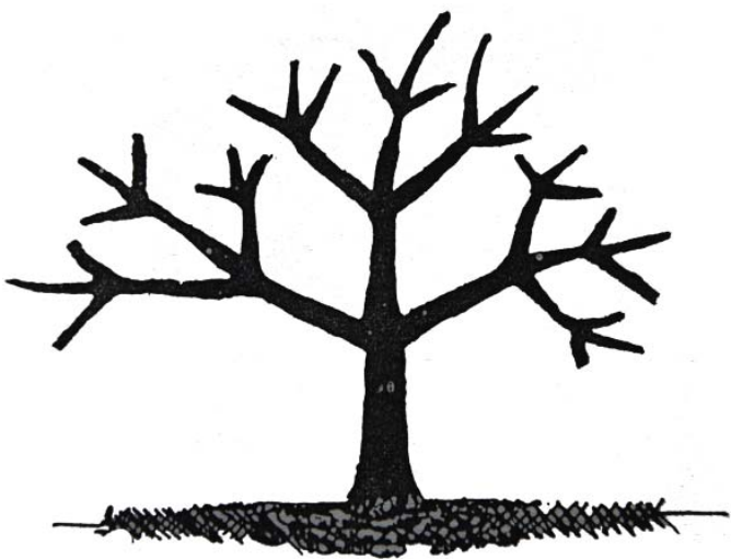
កាត់តែងមែកតាមប្រព័ន្ធ ១-៣-៦-១៨

* ត្រូវកាត់មែកមិនសូវល្អចេញ រៀងរាល់ឆ្នាំដោយ ទុកតាមប្រព័ន្ធ ១-៣-៦-១៨ (ដើម១-មែកធំ ៣-ខ្លែងធំ៦ និងខ្លែង ត្រួយ១៨) បើអាចធ្វើ បានជាការល្អ។