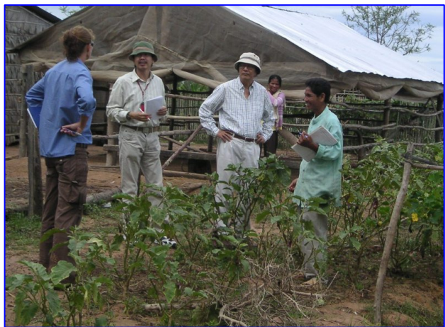
រូបភាពទី ៣៖ ការពិភាក្សាពីផែនការសម្រាប់ឆ្នាំ ២០១០