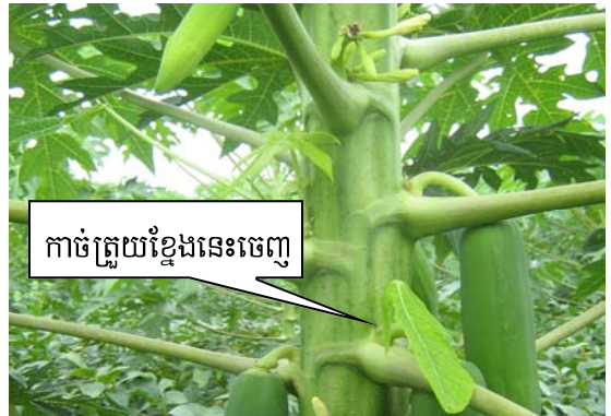
កាច់ត្រួយខ្លាំងនេះចេញ