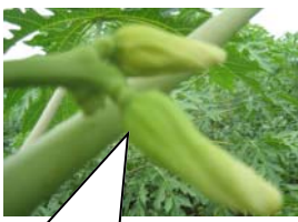
ផ្ការាងមូលខ្លីធំសំរាប់ផ្លែមូល