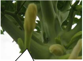
ផ្ការាងទ្រវែងកងសំរាប់ផ្លែវែង

ក្នុងចំការមានសុទ្ធតែផ្លែវែងទាំអស់។ ក្នុងមួយ គុម្ព យើងទុកតែមួយ ដើមទេ។