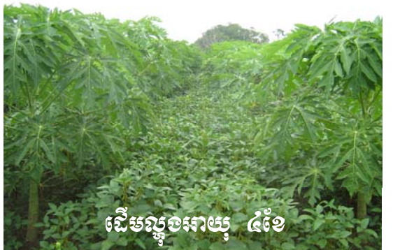
ដើមល្អៗអាយុ ៤ខែ