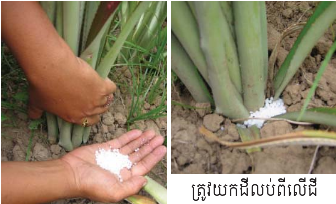
ត្រូវយកដីលប់ពីលើដី

លាមកសត្វ និងដើមកន្ត្រាំងខែត្រ ដោយចាក់ស្រោចតាមគល់ជំនួសជីអ៊ុយរ៉េក៏បាន។ យើងប្រើទឹកជី១ធុងចំណុះ២០លីត្រ សំរាប់ម្ចាស់ ១០០ដើម។