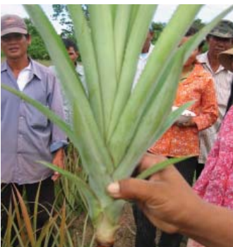
កប់គល់ចូលដី១តឹក

គោ ដែលមានចន្លោះពីគុម្ពមួយទៅគុម្ពមួយ ប្រវែងពី ៣ ទៅ ៤តឹក និងចន្លោះរង ប្រវែង ពី៦ ទៅ ៨តឹក។ យើង ត្រូវកប់គល់កូនម្ចាស់ចូលទៅក្នុងដីប្រមាណ ១តឹក។