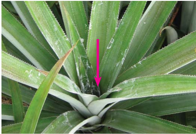
ចាក់ល្អាយទឹកថ្នាំស្ករទាល់តែពេញ

ដើមធំល្អដែលមានស្លឹកលើសពី២០ឡើងទៅ។ យកថ្នាំស្ករលេខ១១ចំនួន ៣ខាំលាយជាមួយ ទឹក១ ធុងចំណុះ ២០លីត្រ រួចយកទឹកល្អាយនេះចាក់ចូល ក្នុងបណ្តាលដើមម្ចាស់ទាល់តែពេញ។ ជាធម្មតា ល្អាយទឹកថ្នាំស្ករ ២០លីត្រ អាចចាក់បាន៣រង ប្រវែង២០ម៉ែត្រ។ ក្រោយចាក់ថ្នាំស្កររយៈពេល ៤ ខែ២០ថ្ងៃទើបម្ចាស់ទុំអាចកាច់យកលក់បាន។